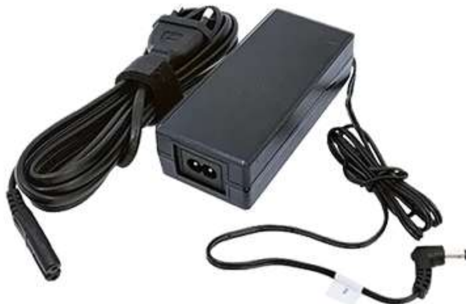
③ 전원 케이블