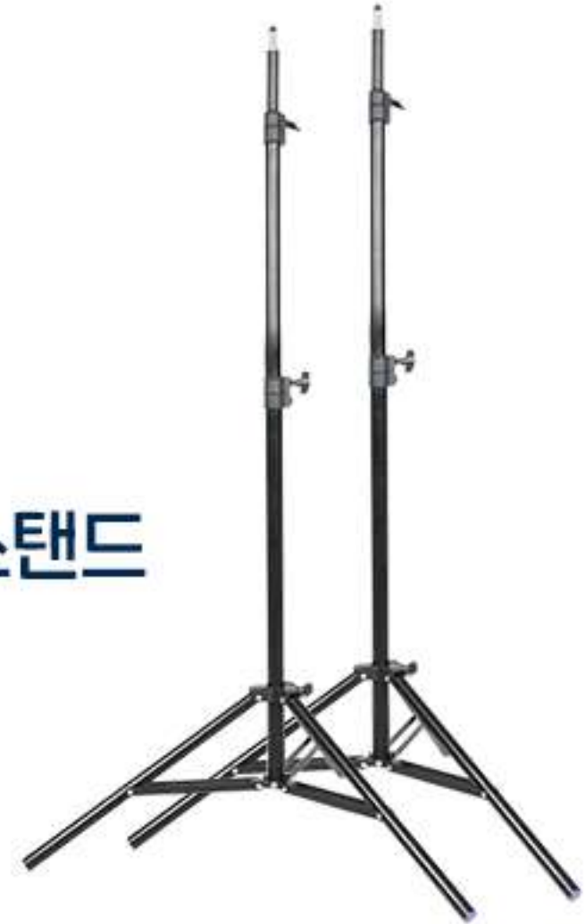
② 조명 스탠드