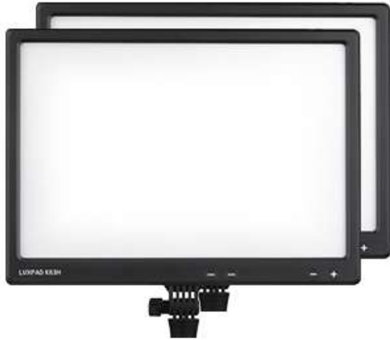
① 룩스패드 조명